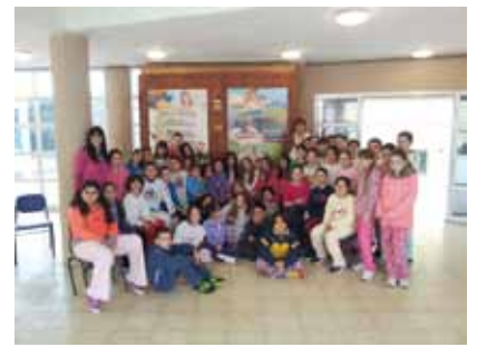
בי"ס "גבעת טל"