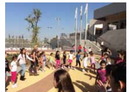
בי"ס "גבעת רם"