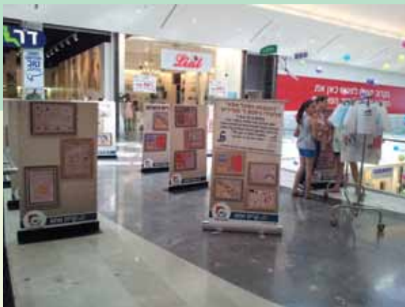
תערוכת הציורים בקניון עזריאלי

במקום הראשון: משפחת גיביש שכתבה הודיה לומדת בבי"ס "יבנה". במקום השני: משפחת בן עוז שכתבה נעם לומדת בבי"ס "גבעת טל". במקום השלישי: משפחת חייט שכתבה דור לומדת בבי"ס "גבעת טל".