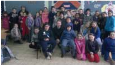
בי"ס "גיבורי עציון"