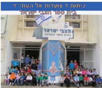
בי"ס "הצבי ישראל"