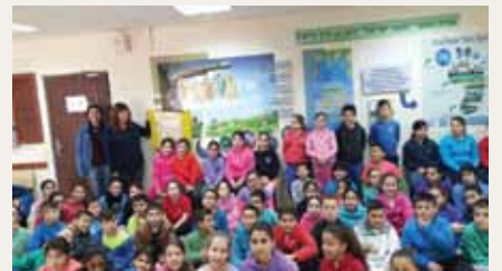
בי"ס "הצבי ישראל"