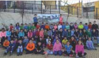
בי"ס "גבעת רם"