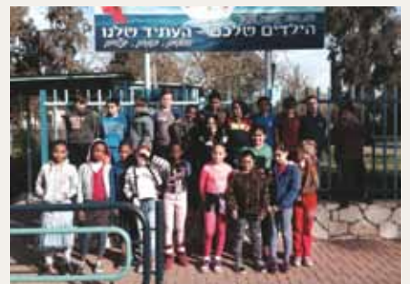
בי"ס "גיבורי עציון"