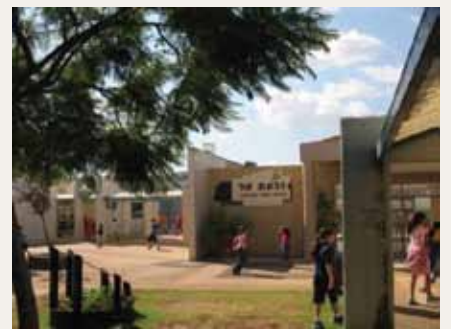
בי"ס "גבעת טל"